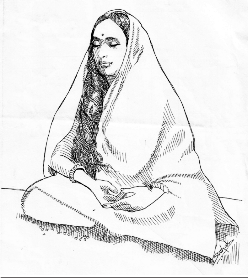
શાંતિદાયિની મા શારદા

જ્યાં સુધી મહામાયા માર્ગ મોકળો ન કરે ત્યાં સુધી કોઈ પણ કશું મેળવી ન શકે. અરે, મારાં બાળકો શરણાગતિ સ્વીકારો. માત્ર શારણાગતિ સ્વીકારો પછી જ તે કૃપાથી રસ્તો સાફ કરશે. ૧૯ મોટાભાગના માણસો માને છે કે, જગતમાં તેને જે કાંઈ સંપત્તિ, પરિવાર, સંતાનો, સત્તા અને પ્રતિષ્ઠા મળ્યાં છે તે બધું તેના શરીર મન અને બુદ્ધિ દ્વારા જ મેળવ્યું છે. આ સમજને લીધે આ બધી વ્યક્તિઓ અને વસ્તુઓ છેવટે તો માણસની અશાંતિ અને અર્જપાનાં જ કારણો બને છે. મા આપણને કહી રહ્યાં છે કે, તેં જે કંઈ મેળવ્યું છે તે બધું તને ઈશ્વરે જ આપ્યું. છે. તેથી તું એ બધી જ વસ્તુઓ ઈશ્વરને ચરણે ધરી દે. હંમેશાં તેનું જ સ્મરણ કર. તારા મનની