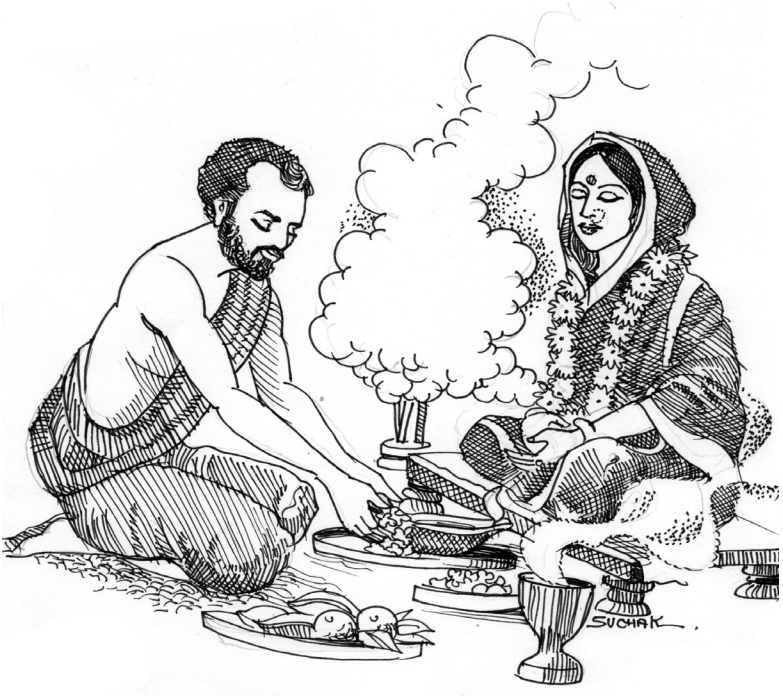
શ્રી રામકૃષ્ણએ પત્ની શારદાની કરેલી પૂજા