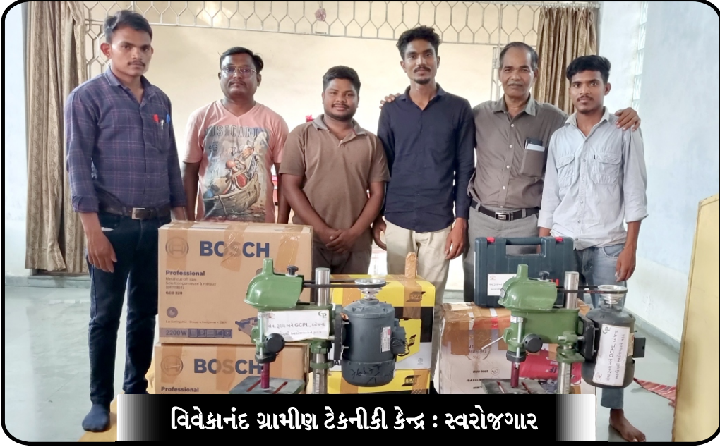
વિવેકાનંદ ગ્રામીણ ટેકનીકી કેન્દ્ર : સ્વરોજગાર

'અમે તે ઈશ્વરના દાસ છીએ, જેને અજ્ઞાનીઓ "મનુષ્ય" કહે છે.' સ્વામી વિવેકાનંદ